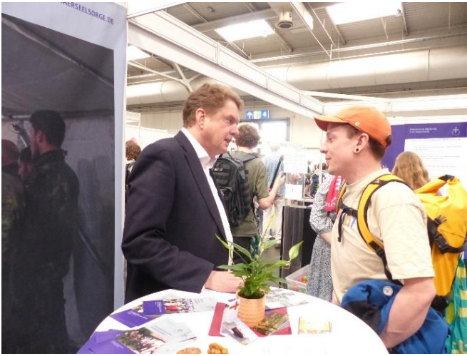
Messestand „Auf der Koje“