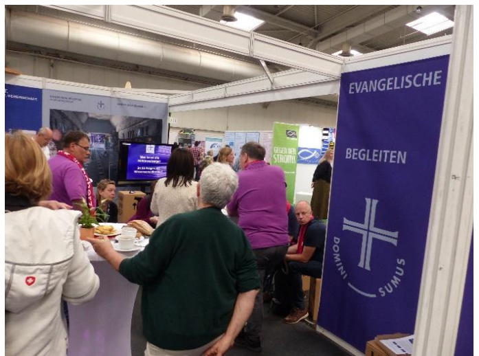
Messestand „Auf der Koje“